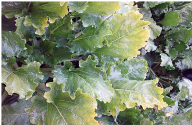
写真2 てんさいの黄化病

滝上町でも発生が見られていま す。滝上町では、発生程度は軽く減 収はないと思われませんが、油断は禁 物です。防除を行う場合は、6月下 旬~8月上旬にネオニコチノイド系 農薬(アクタラ顆粒水溶性、ダント ツ水溶性またはリーズン顆粒水和 剤)を、茎葉散布しましょう。