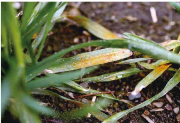
写真1 秋まき小麦の赤さび病 (平成25年5月撮影 小野寺原図)