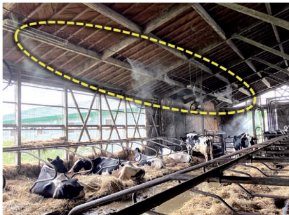
写真4 ミストの事例

牛や牛床を濡らす前に気化させることが重要であり、送風機と併用して冷却した空気を牛体に当てます (写真4)。