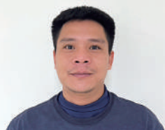
レー テー ソン 33歳／(株)岩田