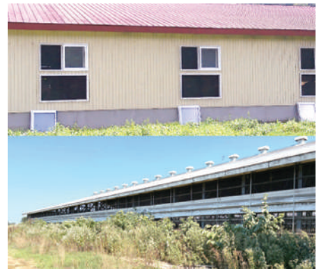
写真3 (上) 窓枠撤去による入気拡大 (下) 雑草による換気不良