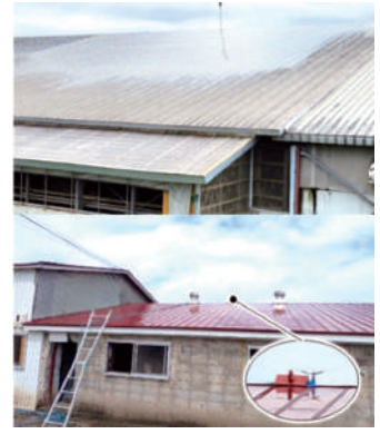
写真2 市販のスプリンクラーを使用した屋根散水