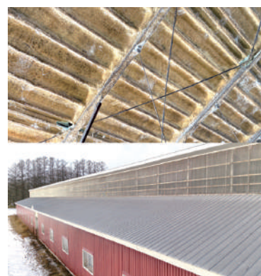
写真1 (上)ウレタン吹付、(下)遮熱塗料の施工事例

断熱材のない既存牛舎では、ウレタン吹付や白色塗装、遮熱塗料の施工が有効です（写真1）。 屋根に散水した水が蒸発する際の気化熱により、屋根表面温度の上昇を抑え、牛舎内へのふく射熱の侵入を軽減します。