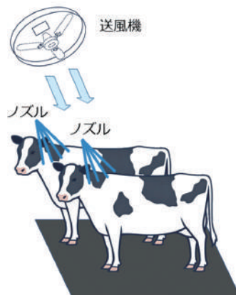
写真5 ソーカー設置例

水をかけて牛体を濡らし、風を当てて水を蒸発させることで牛体を冷やします (写真5)。冷たい水を直接かけることによる冷却効果もあるため、外気の湿度が高い環境でも効果が期待できます。